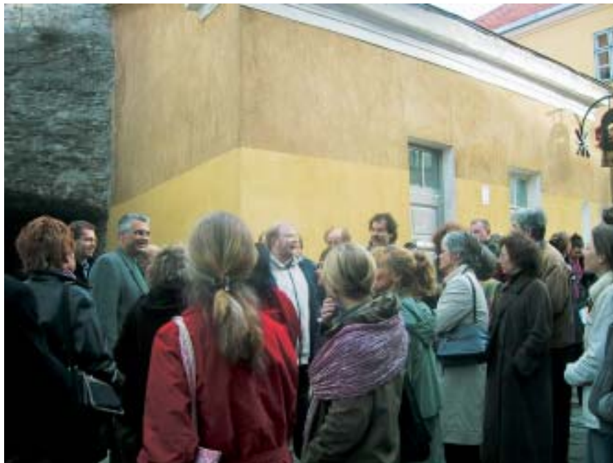
På stadsvandring genom gamla stan med Mart Laar, i mitten av bilden.