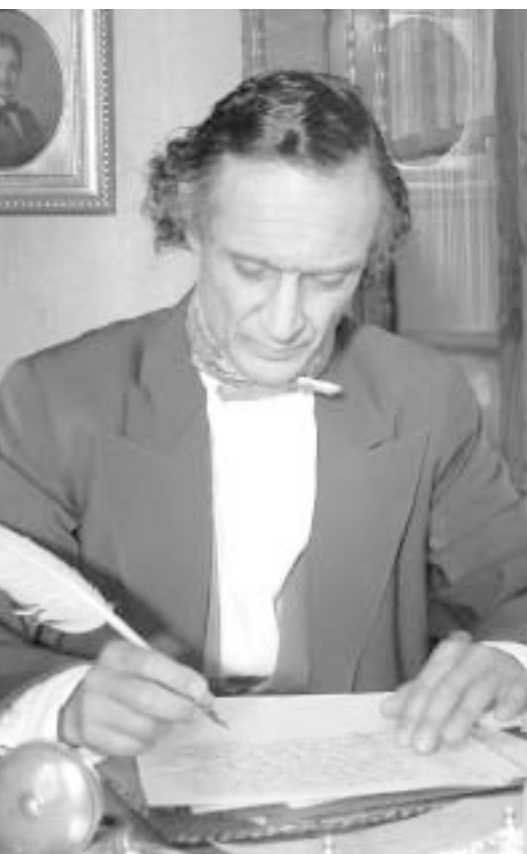
HC Andersen figurerar också i filmen.

Något så ovanligt som läs- och skrivsvårigheter på Filmhuset i Stockholm. Två flickor som just börjar läsa och skriva. Deras läs- och skrivsvårigheter är mycket olika. Goda råd om hur man kan hjälpa barn med läs- och skrivsvårigheter.