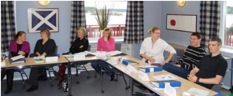
Facklig kurs i Waxholm november 2008

Idén med vår fackliga verksamhet i yrkesföreningarna är att få medlemmar och förtroendemän att med stöd av ombudsmän på SRAT enas om gemensamma mål och tillsammans arbeta för att uppnå dessa. Man har goda möjligheter att uppnå sina mål om alla driver på i samma riktning. Man bestämmer vilka mål som är kortsiktiga, vilka som är mer långsiktiga och vilka som man ska ta itu med först och vilka som kan vänta en tid. Man bygger upp ett kontaktnät med personer man ska bearbeta och förse med vår information och man fördelar arbetet mellan medlemmar, förtroendemän och ombudsmän.