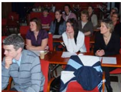
Temadagen 2008 – Hörselvård i förändring

En viktig del av SRATs arbete med Audionomerna är att stimulera till fortbildning och därmed bidra till utvecklingen av yrket. De temadagar som arrangerats varje år sedan föreningen bildades är ett led i det arbetet. Vi har försökt att ta upp sådana frågor som känts mest aktuella vid varje tidpunkt. Det är då legitimationen infördes var konsekvenserna för audionomerna av detta ett självklart ämne för Temadagen.