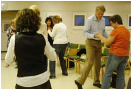
Lokalföreningen i Skåne har danskurs på ett av sina möten.

Följande audionomer har förening- en haft som ordförande under åren (föreningsmöte hålls varje år innan maj månads utgång):